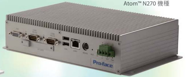
PE4000B Atom™ N270 機種