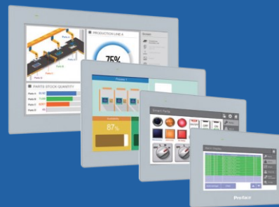
Entry HMI ET6000 Series

ET6000 시리즈는 HMI의 충분한 기능을 제공하면서도 경제적인 제품입니다. 기존 사용하던 하드웨어 및 소프트웨어와의 호환성을 통해서 간편히 신제품으로 변경이 가능합니다.