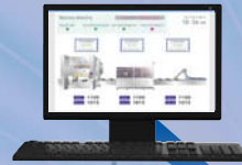
設備 4 資料收集電腦