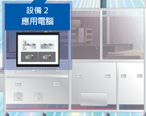
設備 2 應用電腦