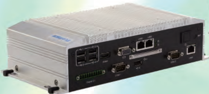
PE4000B Atom™ N2600 机型