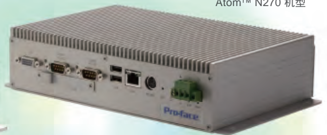
PE4000B Atom™ N270 机型