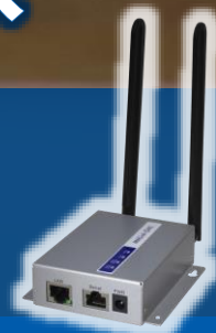
産業用LTEゲートウェイ MMLink-GWL