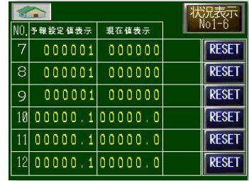
予報値一覧モニター