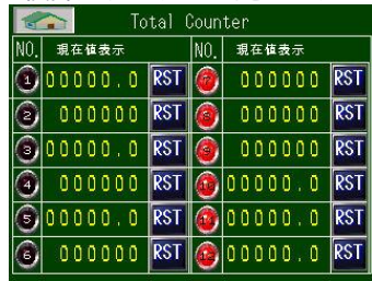
積算カウンター一覧モニター