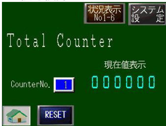
入力信号積算カウンターモニター