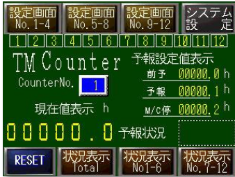
タイマー現在値モニター