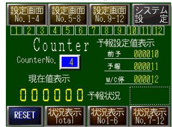
カウンター現在値モニター