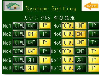
カウンター・タイマー機能選択