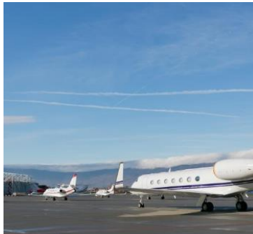
즉시 현지로 출발할 시간도 없고 비용도 부담스럽습니다.