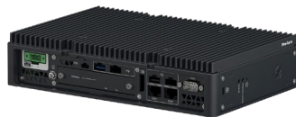
PS-6000B スタンダードボックス