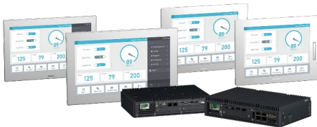
PS-6000B アドバンスボックス