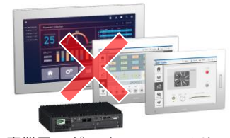
産業用コンピューター PS6000シリーズ

電源障害が発生するとパソコンは停止してしまい、重要なデータが損失してしまうことがある