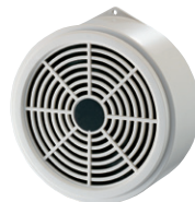
コーンスピーカー NS-13C