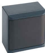
コーンスピーカー NS-38