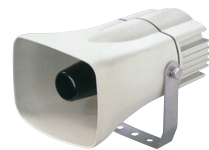
ホーンスピーカー NS-25