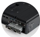
内部拡張 インターフェイス