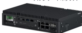
PS-6000B スタンダードボックス