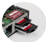
HDD/SSDや メモリーも変更可能