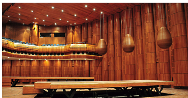
Auditorium de Montreux, Suisse