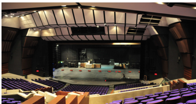
Acropolis de Nice