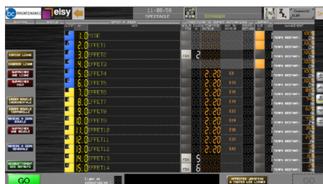
Vue du pilotage scénique avec GP-Pro EX

Aujourd'hui, nous continuons toujours avec Pro-face pour la fiabilité de vos produits, notamment le logiciel de runtime WinGP, et la facilité de prise en main, comme avec GP Pro EX, votre outil de développement d'application.